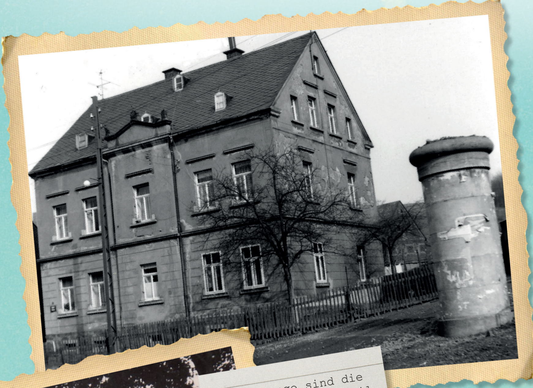
Schon lange sind die Litfaßsäulen ein Teil des Stadtgebietes und wurden mal mehr mal weniger intensiv genutzt