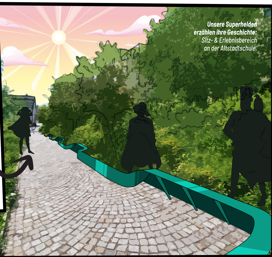
Unsere Superhelden erzählen ihre Geschichte: Sitz- & Erlebnissbereich an der Altstadtschule.